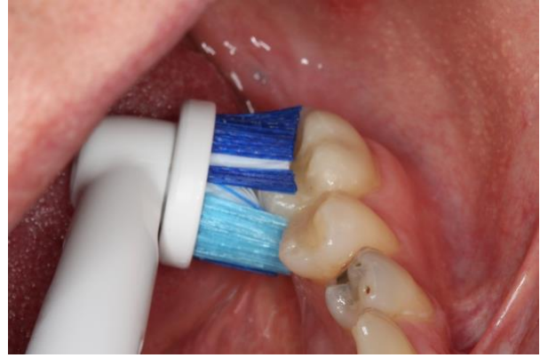
Kielen puoleisten hammaspintojen puhdistus