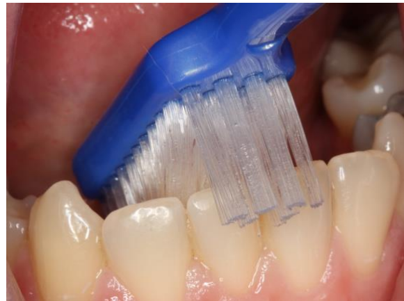
Alaetualueella hammasharjan voi kääntää pystyasentoon