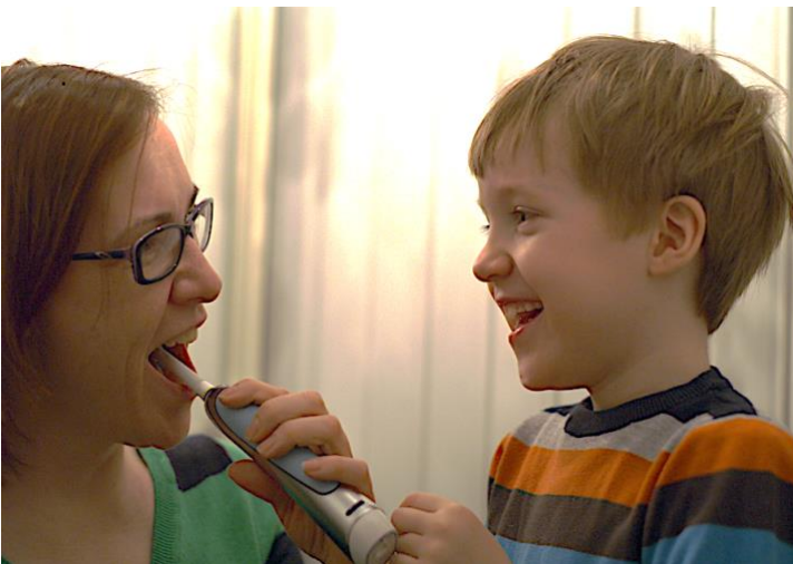
Hampaiden hoitotottumukset opitaan varhain. Toimithan hyvänä mallina lapsellesi ja lapsenlapsellesi.