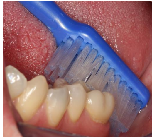
Viimeisen hampaan takapinnan puhdistus