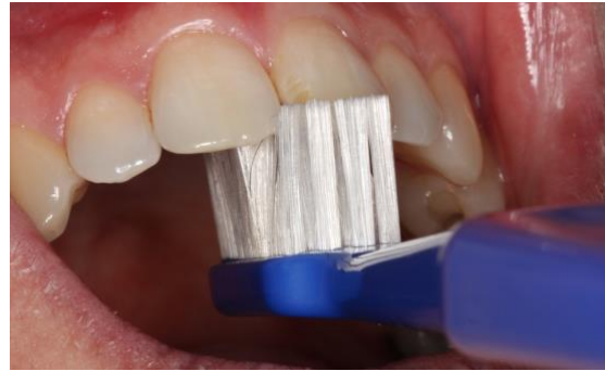
Yläetualueella hammasharjan voi kääntää pystyasentoon