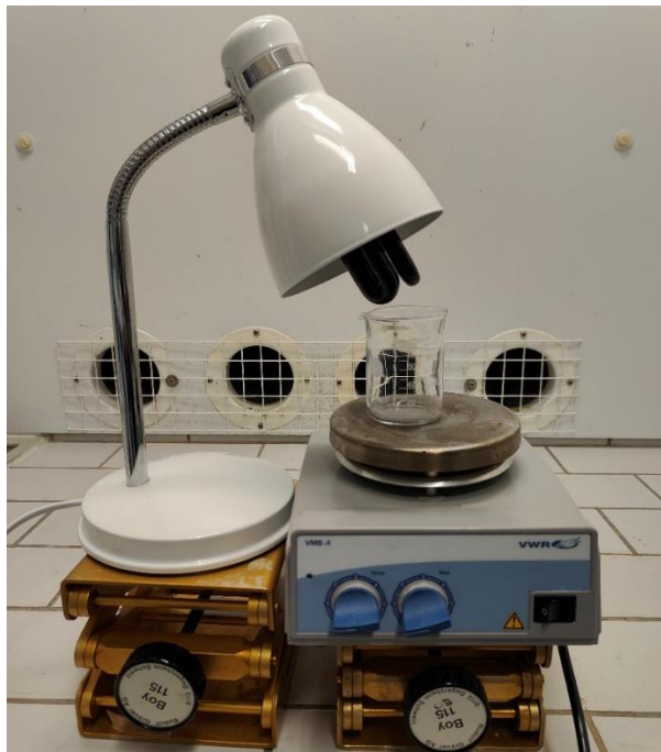
Kuva 1 Kuva koelaitteistosta