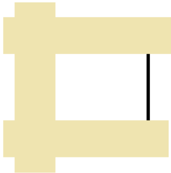
Kuva 3 Teippaukset lasin kolmeen reunaan.