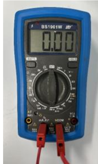
Kuva 2 Ampeereiden mittaus yleismittarilla.