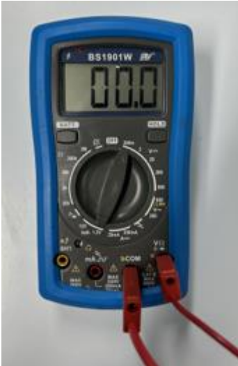
Kuva 1 Volttien mittaus yleismittarilla.

Työssä käytetään yleismittareita jännitteen mittaamiseen. Yleismittarilla voidaan mitata jännitettä mV ja esimerkiksi kennon ampeereita mA. Kun mitataan kennon voltteja, täytyy mittari olla asetettuna 200 mV asentoon. Hauenleukojen täytyy myös olla oikeissa kohdissa, jotta volttien mittaus onnistuu.