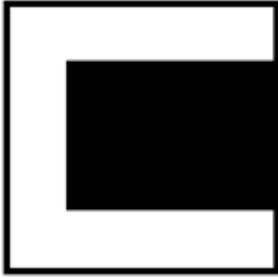
Kuva 4 Väritä lasin keskiosaan lyijykynällä musta alue.