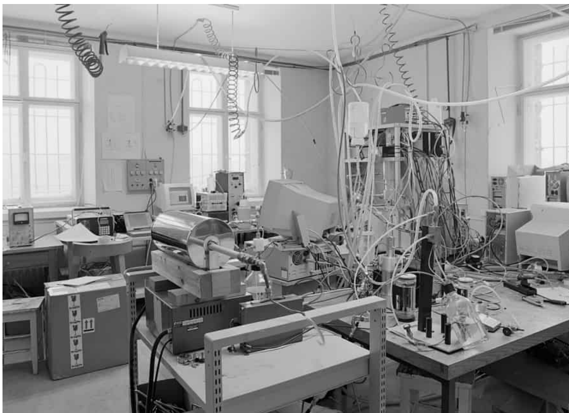
Forskningsutrustning på fysiklaboratoriet 2001. Ett av universitetsmuseets mål för framtiden är att inventera de museala samlingarna på olika campus.