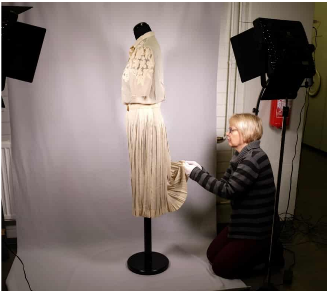
Man håller på att arrangera en dräkt som ingår i slöjdvetenskapens kollektion inför fotografering.

Sedan 2017 har museet reprofotograferat fotografierna i stället för att skanna dem, och en visstidsanställd museiamanuens har arbetat vidare med digitalisering, katalogisering och kundservice.