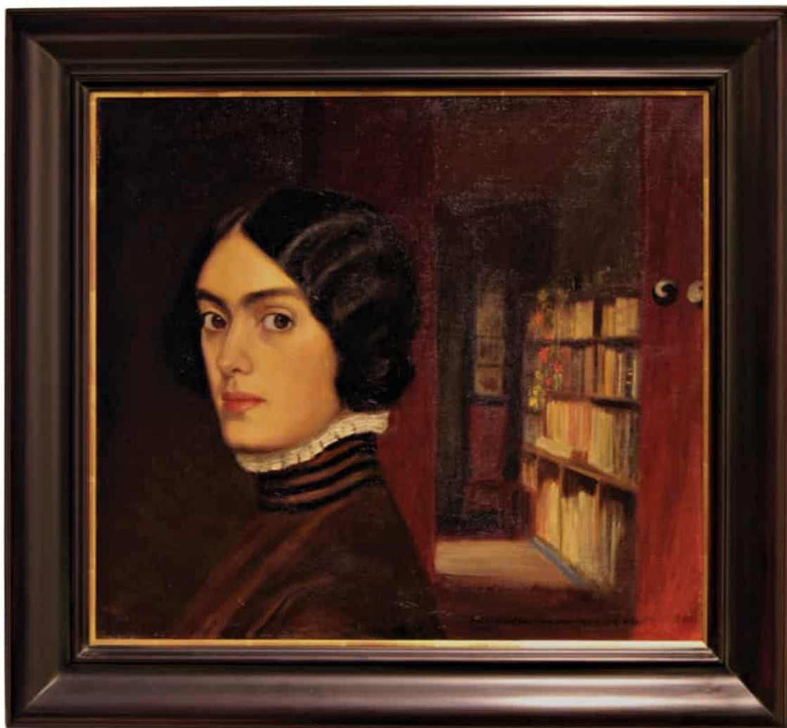
Olga Gummerus-Ehrström 1908: Självporträtt.

Byggnadsritningssamlingen bildades på Helsingfors universitets museum på 1980-talet. Man samlade in historiska byggnadsritningar för universitetets fastigheter från olika institutioner vid universitetet och museet tillvaratog den historiska delen av byggnadsritningsarkivet vid universitetets tekniska avdelning. År 2003 bestod samlingen av cirka 1 300 ritningar över universitetets fastigheter från 1800- och 1900-talet. Byggnadsritningssamlingen hade främst utökats genom flyttningar från universitetets institutioner och tekniska avdelning, men till en del också genom donationer.