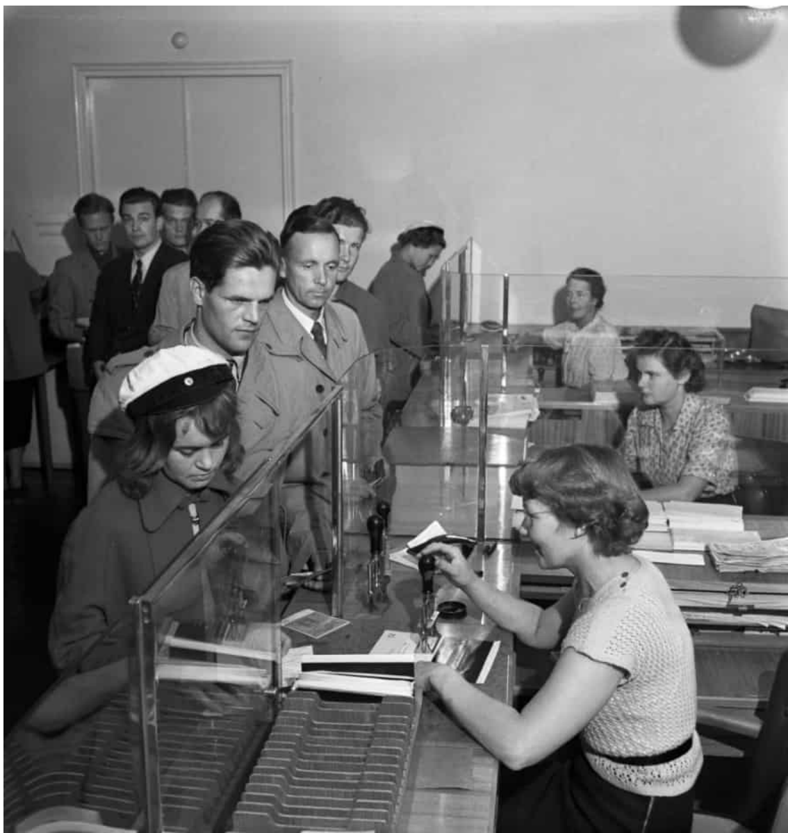
Flitig aktivitet i universitets kassa i början av läsåret. Foto Yrjö Lintunen 1950–52.