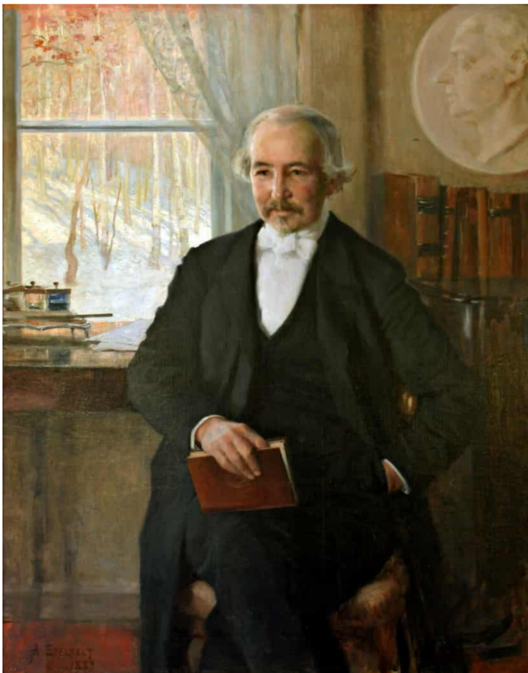
Albert Edelfelt 1889: Zacharias Topelius. Topelius var professor i historia och rektor vid Helsingfors universitet på 1850–1870-talen, men även en känd författare. På väggen till höger om honom i porträttet hänger en rund gipsrelief som föreställer nationalskalden J.L. Runeberg.

Medicinhistoriska museet förde ett begränsat kartotek över sina föremål på 1960-talet. År 1970 började man diarieföra en del av donationerna och slutade upprätthålla kartoteket. En del av föremålen fick lappar med uppgifter om deras proveniens. År 1978 katalogiserades 336 föremål i röntgensamlingen och 1984