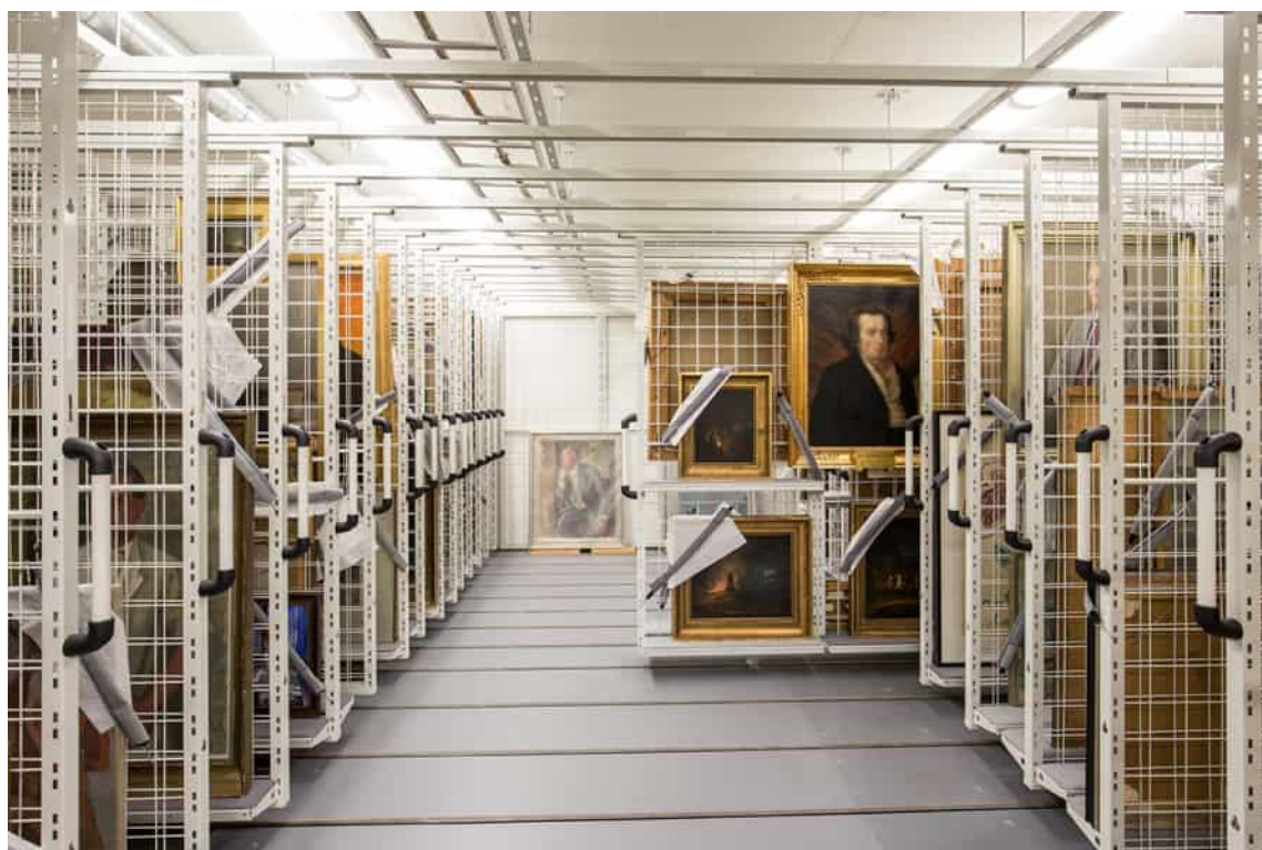
Konstverk hänger på gallernätväggar på räls i Universitetsmuseets föremålsmagasin.

pappkartonger lagda i kuvert som ordnats efter ämne. En del av fotografierna har klistrats på arkivpapp för att göra det lättare att bläddra bland dem. Alla gamla förvaringsmaterial är inte arkivbeständiga, så man försöker byta ut dem mot material som uppfyller dagens standard. Nya fotografier som läggs till i samlingen placeras i museala pappkartonger efter proveniens.