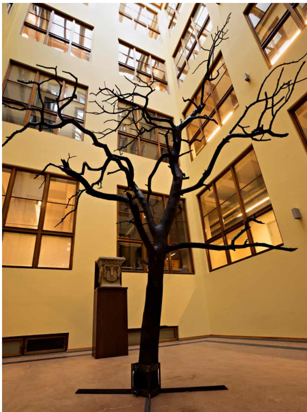
Landys Roimola 2017: Tree. Verket består av ett träd som föll i stormen Kiira på Drumsö. Ytan på trädet har behandlats genom bränning. Konstnären har donerat verket till universitetet och det står på en ljusgård på Centrumcampus. Foto Timo Huvilinna 2018.