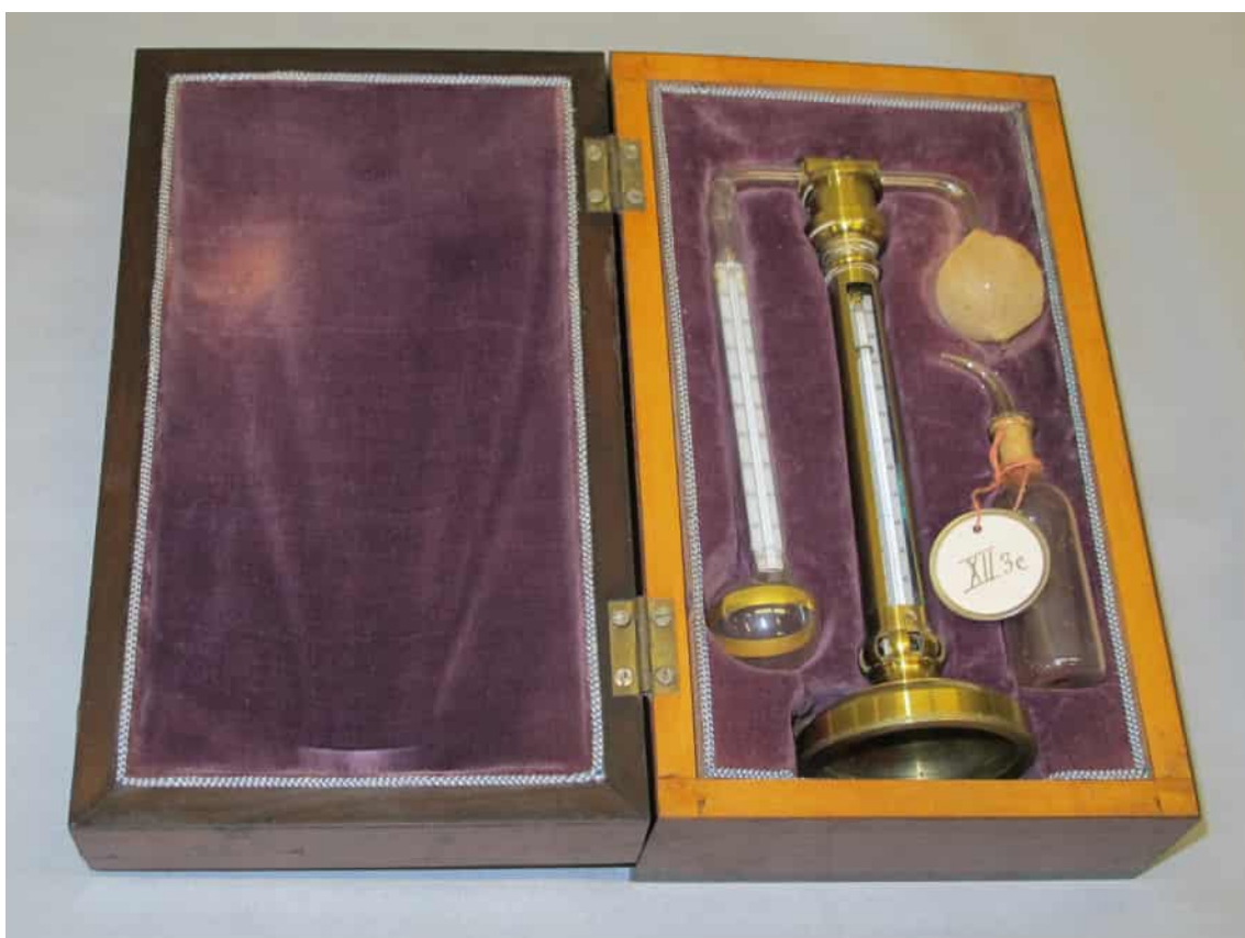
Daniells kondensationshygrometer från 1839 som ingår i Fysikaliska kabinetts samlingar.