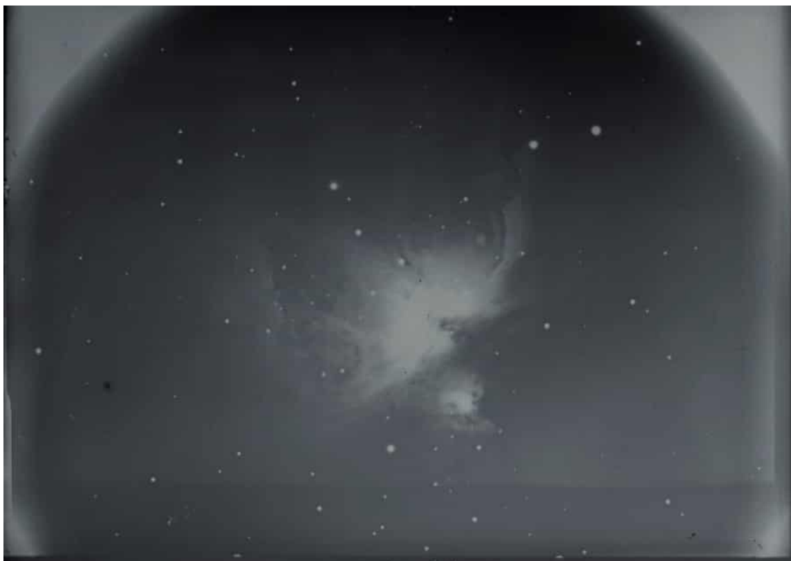
Stjärnfotografi på glasplåt. Bilden visar Orionnebulosan Messier 42 fotograferad med sex timmars exponering med dubbelrefraktorn på observatoriet vid Helsingfors universitet.

Den universitetshistoriska fotografisamlingen innehåller foton av personer och fastigheter samt foton med anknytning till undervisning, forskning, studieliv, studier och festtraditioner. Samlingen har i huvudsak utökats genom donationer, inköp och interna flyttningar vid universitetet. Museet strävar dessutom efter att dokumentera universitetets fastigheter och universitetsrelaterade evenemang genom fotografering när det är möjligt.