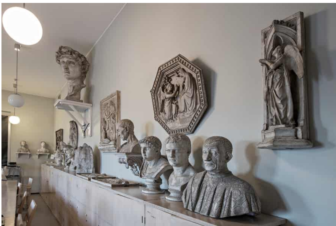
Delar av den konsthistoriska skulptursamlingen i konsthistoriens studiesal på fjärde våningen i den gamla delen av universitetet.