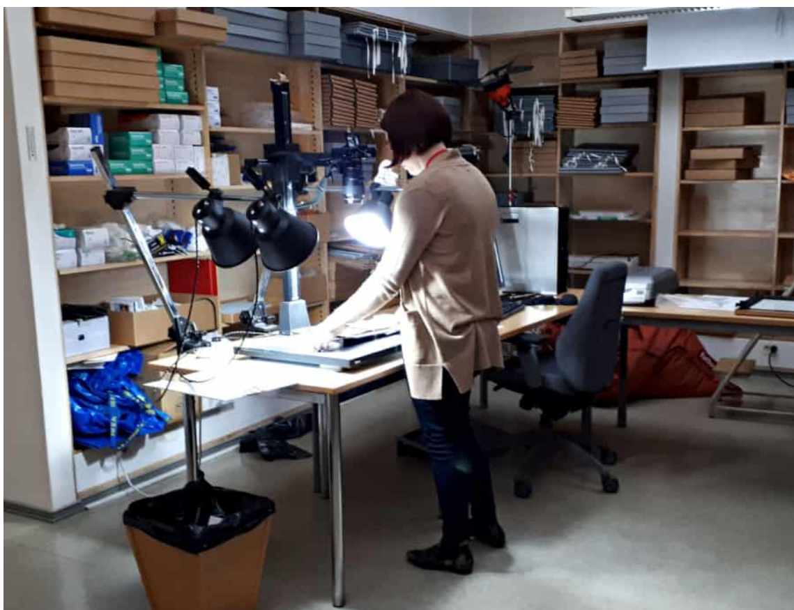
Digitalisering av foton i museets arkivlokaler. Foto Katariina Pehkonen 2019.

försöker hålla koll på samlingarnas skick för att upptäcka när ett föremål eller konstverk behöver konserveras.