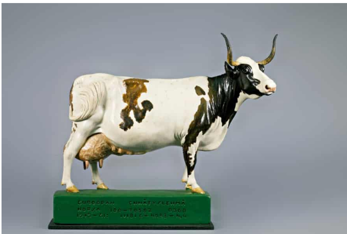
Rekordkon Nopsa. Miniatyrskulptur av skulptören Anton Ravander-Rauas 1958. Foto Timo Huvilinna 2015.

de var i dåligt skick eller svåra att rengöra, för att det fanns lite kontextuppgifter eller en stor mängd av samma föremålstyp. I andra lokaler finns emellertid ännu cirka 500 föremål som ingår i samlingen och som inte omfattades av räddnings- och rengöringsoperationen i lantbruksmuseibygnaden. Tanken är att dessa ska sorteras, rengöras och flyttas till Sarka under 2019–2020.