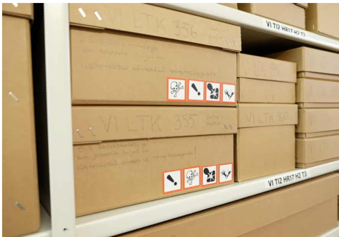
Arkivlådor försedda med varningsdekaler i lokalen där museets samlingar hanteras.

Alla samlingsobjekt ska hanteras särskilt varsamt med hänsyn till deras ålder, skick och material. Man ska ta tag i museiföremål och konstverk både underifrån och från sidan, och när man flyttar tyngre föremål eller verk ska man med fördel använda tillgängliga hjälpmedel, som lyftbord och bordsvagn med hjul. Flyttningar utgör alltid en risk för samlingarna, och i idealfallet behöver de inte flyttas ofta. Det rådande behovet av lokalbesparingar har tyvärr lett till att man varit tvungen att flytta universitetsmuseets samlingar orimligt ofta.