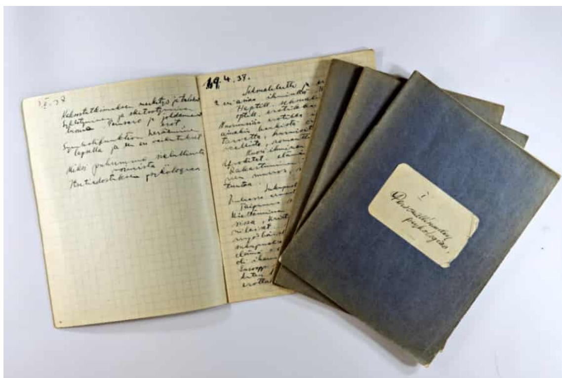
Föreläsninganteckningar i personlighetspsykologi från föreläsningar av Eino Kaila, professor i teoretisk filosofi, vårterminen 1937. Foto Timo Huvilinna 2017.

Universitetsmuseet försöker om möjligt hänvisa till andra samlingar eller museer när museet blir erbjudet material som inte passar in i samlingarna. Till exempel kan vi hänvisa till universitetets arkiv och registratur när det gäller arkivmaterial med anknytning till universitetet, till Nationalbiblioteket eller Helsingfors universitets bibliotek när det gäller böcker och Finlands Hantverksmuseum när det gäller textilier som saknar koppling till slöjdläro-utbildningen eller ämnet slöjdvetenskap.