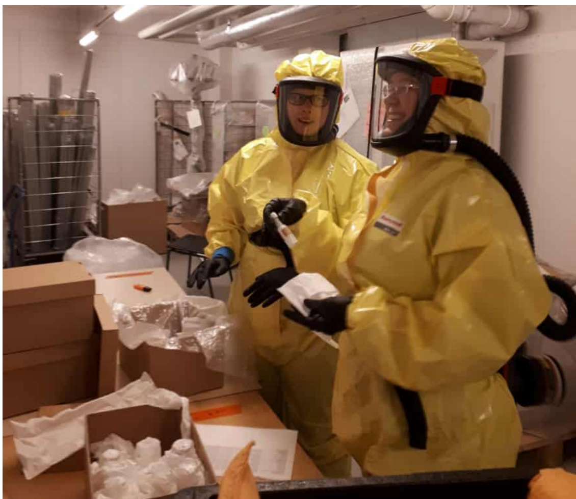
Hantering av kemikalier som ingår i museets samlingar i ändamålsenlig skyddsutrustning.

Museipersonalen använder sig av säkerhetshandboken Museokokoelmien vaaralliset aineet ja esineet sekä niiden käsittely (Sinisalo 2018, ung. Farliga ämnen i museisamlingar och hur de ska hanteras) som uppdateras vid behov. Universitetsmuseets personal har hållit föredrag om ämnet såväl i Finland som utomlands och skrivit artiklar om det i tidskriften Konservaattori , så museet har en gedigen expertis på ämnet.