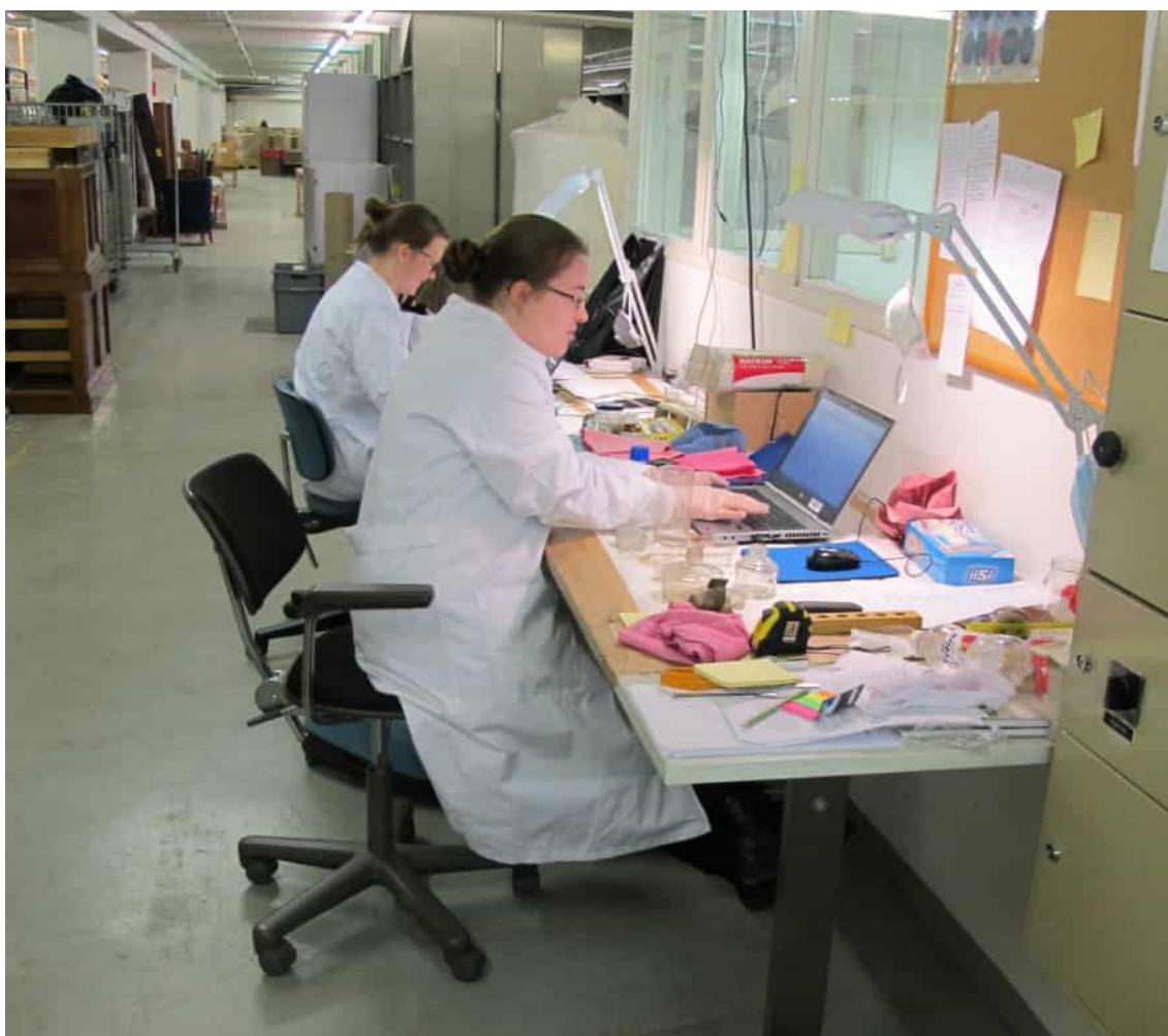
Universitetsmuseets flytteam sparar föremålsuppgifter i samlingsförvaltningssystemet i föremålsmagasinet på Industriegatan, som museet lämnade 2014. 2014.

Den universitetshistoriska föremålssamlingen är idag tämligen välkatalogiserad. Museet försöker katalogisera nya föremål så snart som möjligt efter att man tagit emot dem. Även den största delen av den universitetshistoriska fotografisamlingen har katalogiserats. Det finns uppskattningsvis 2 500 okatalogiserade fotografier.