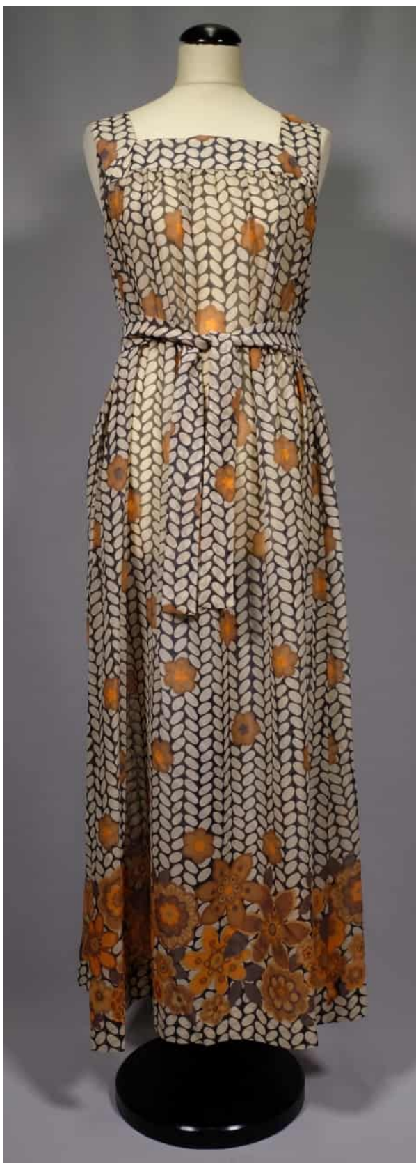
Aftonklänning för sommarbruk från Riitta Immonen Sports kollektion. Klänningen ingår i slöjdvetenskapens kollektion.