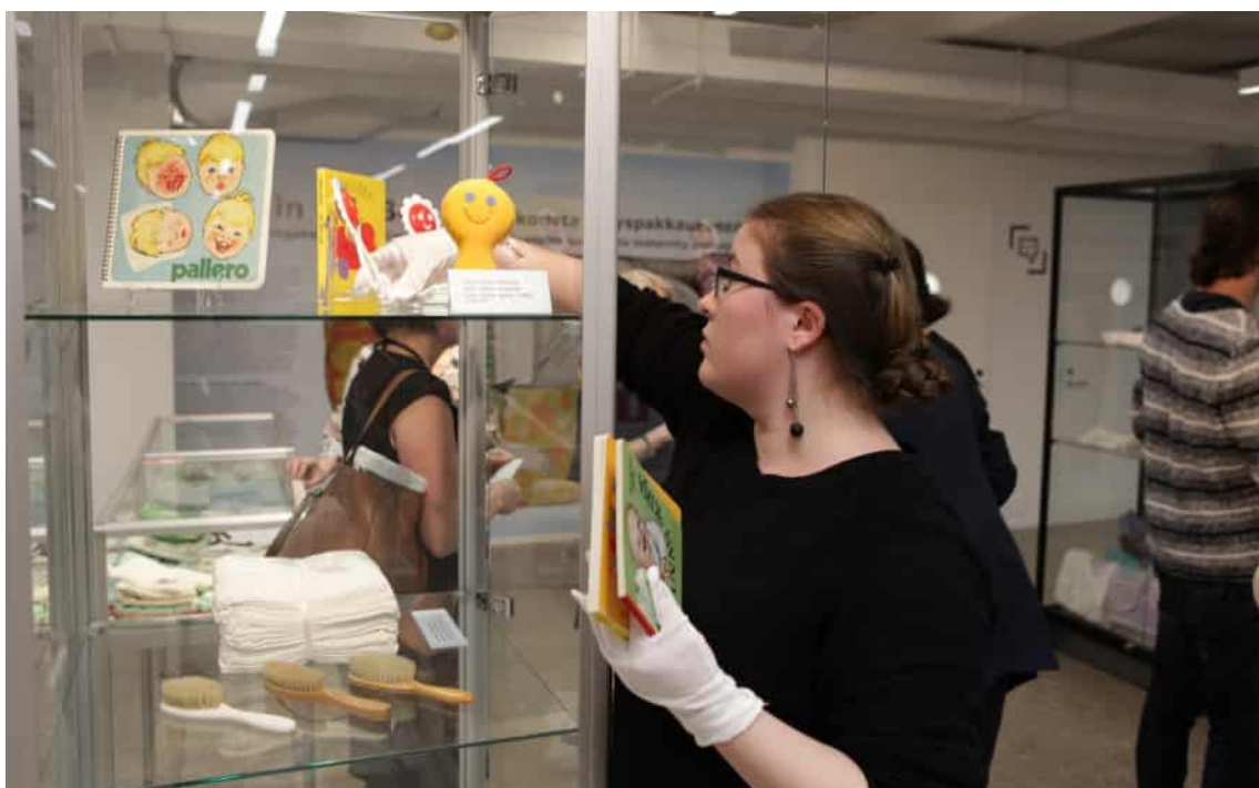
Universitetsmuseets utställning Baby in the Box som presenterar moderskapsförpackningens historia byggs i Tankehörnan.

objekt. Om objektet inte har lagts till i samlingen, fotograferas det och grunduppgifterna antecknas för utgallringsprotokollet.