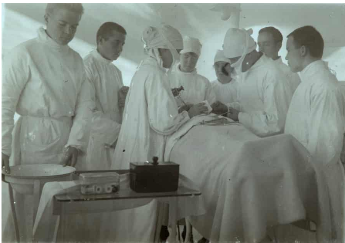
Vårdpersonal på militärsjukhuset i Viborg utför ett ingrepp på en patient på 1920–30-talet.

en samling med exlibris från anställda inom hälsovårdssektorn. Till medicinska samlingar med koppling till Helsingfors universitets historia hör bland annat vaxbildssamlingen Ylppös barn och Hygieniska institutionens miniatyrmodellsamling. Framför allt sedan 1970-talet har donatorer spelat en stor roll för samlingarnas tillkomst.