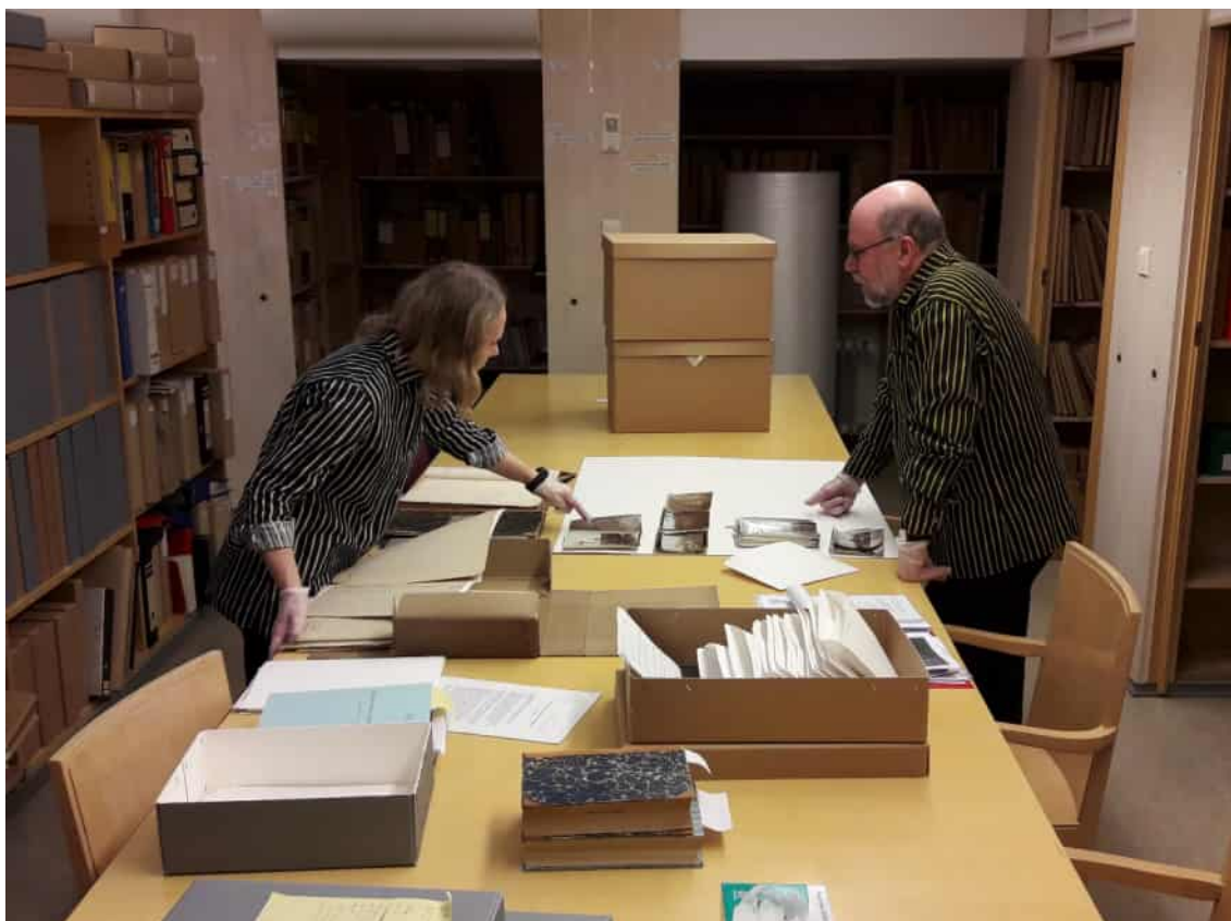
Fotokonstforskare i kundtjänstlokalen för universitetsmuseets fotografisamlingar. Foto Henna Sinisalo 2016.

Även om universitetsmuseet liksom andra museer strävar efter tillgänglighet och att öppna sina samlingar för den breda allmänheten måste man alltid ta hänsyn till upphovsrättsbestämmelserna och dataskyddslagstiftningen både när man lagrar information i samlingsförvaltningssystemet och när man betjänar kunder som använder sig av samlingarna. Lagarnas och bestämmelsernas begränsningar beskrivs närmare i inledningskapitlet.