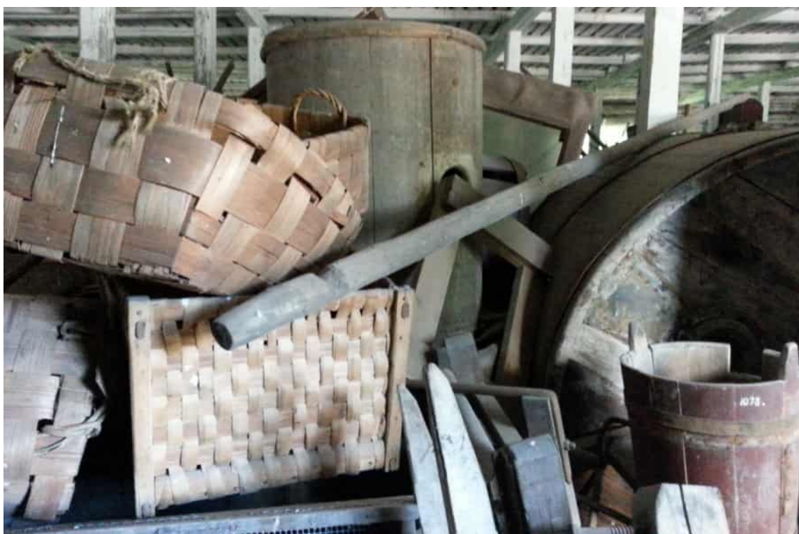
En hög med mycket smutsiga föremål som ingår i Lantbruksmuseets samlingar.

Museimaterial säljs inte. I undantagsfall kan en museal möbel säljas vid en auktion som anordnas av universitetet, om det handlar om en möbel som funnits i bruk i universitetets lokaler och som man inte vill inkludera i den egentliga samlingen som förvaras i museets föremålsmagasin efter att möbeln tagits ur bruk. Det kan handla om möbler som inte ingår i det ursprungliga möblemanget i en universitetsfastighet eller annars saknar en nära koppling dit och sådana som det redan finns flera av i museets samlingar. Beslutet fattas alltid fall för fall gemensamt av samlingschefen och museiamanuensen med ansvar för konst och möbler. I vissa fall erbjuds möbeln till andra museer innan den läggs ut till försäljning. Museipersonalen, deras familjemedlemmar och andra närstående personer har inte rätt att köpa ett föremål som gallrats ut ur museets samlingar.