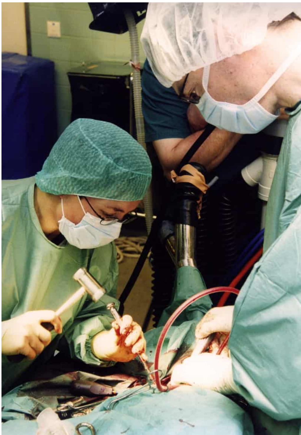
En häst får en tand rotfylld vid universitetets djursjukhus. Foto Veikko Somerpuro 2003.

I Helsingfors universitets museums ansvarsområde ingick också att sköta Finlands största porträttsamling Galleria Academica och andra konstverk. Porträttsamlingen uppstod när kanslern vid Kungliga Akademien i Åbo Per Brahe donerade sitt porträtt till akademiens bibliotek 1652. Det finns sexton stycken