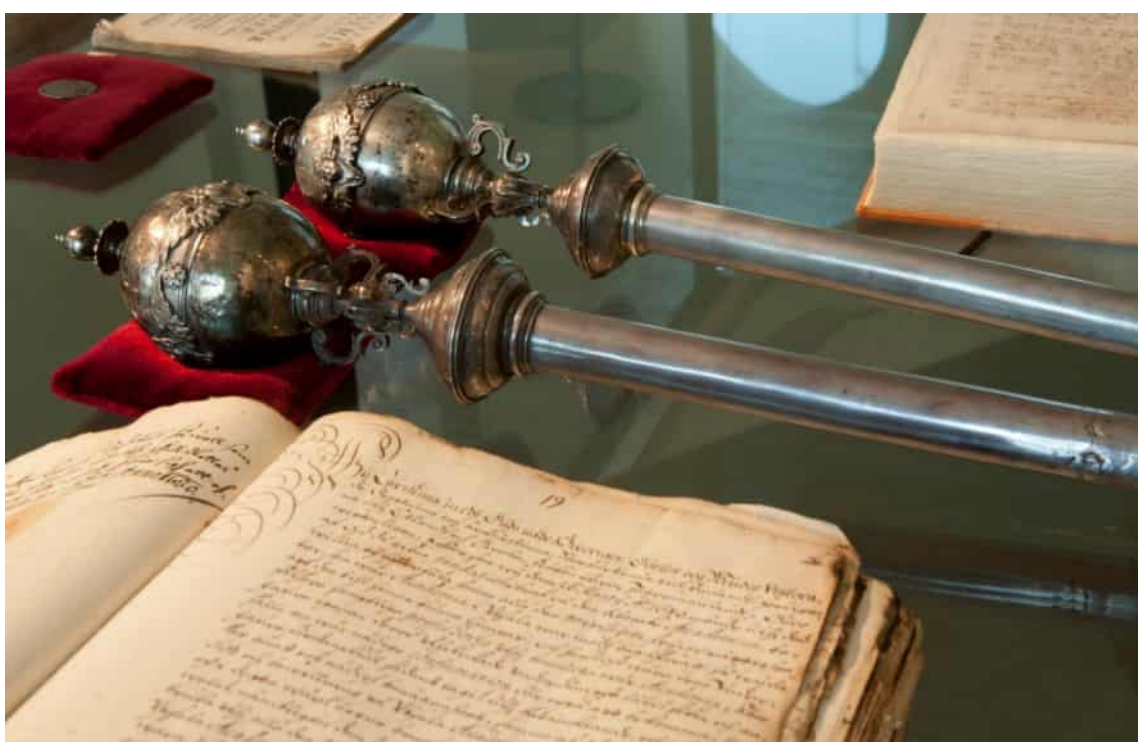
Rektorsspiror i silver från 1640 i universitetsmuseets utställning.

Ramarna, verksamhetsprinciperna och målen för Helsingfors universitetsmuseums samlingsverksamhet fastställs i museets samlingspolitiska program. I programmet presenteras museets samlingar, deras uppkomst samt principerna för hur de utökas, sköts och tillgängliggörs. Samtidigt utvärderas verksamheten och de mest centrala framtidsmålen för samlingsarbetet görs upp. Det samlingspolitiska programmets innehåll utvärderas med jämna mellanrum och programmet uppdateras vid behov. Universitetsmuseets samlingschef har ansvaret för uppdateringen tillsammans med samlingssteamet.