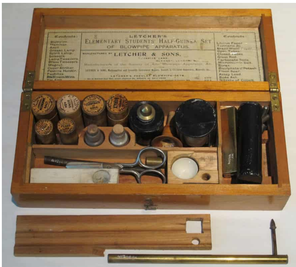
Blåsrörsutrustning som använts av geologer. Den användes för snabbanalyser ute på fältet.

Helsingfors universitets museum grundades 1978, då museiamanensen började dokumentera och samla in museala föremål i säkerhetsupplaget i administrationsbyggnadens tredje källarvåning.