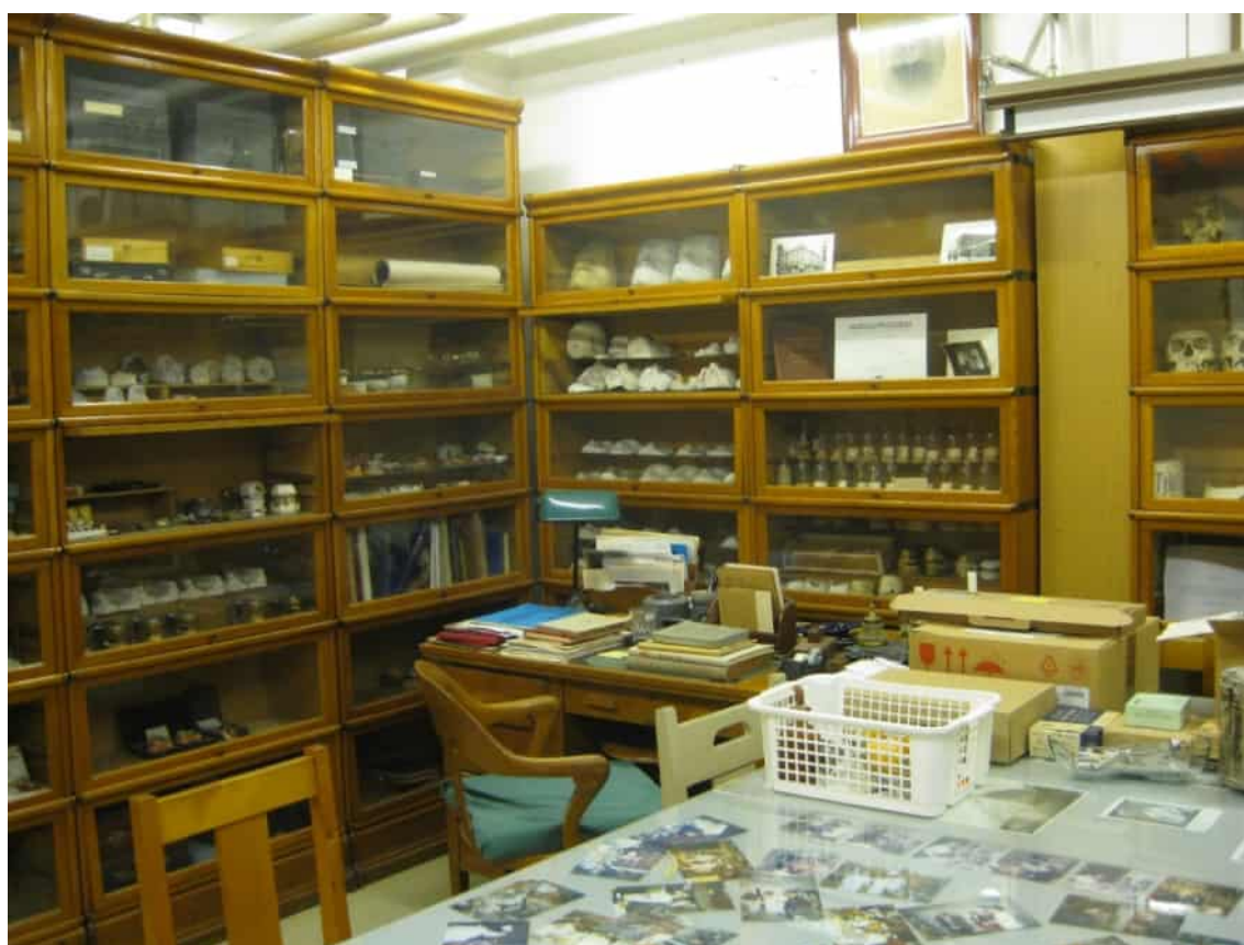
Förvaringslokaler för Odontologiska museets samlingar i Brunakärr. Museet kommer att lämna lokalen 2020. Foto Henna Sinisalo 2014.

En del av föremålen flyttades till universitetsmuseets nya permanenta utställning i Arpeanum 2003 och en del därifrån vidare till museets föremålsmagasin 2014. Odontologiskt arkivmaterial flyttades från universitetsmuseet till universitetets centralarkiv 2016.