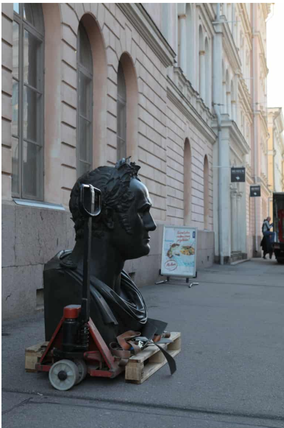
Bronsbyst av Alexander I gjord av Ivan Martos 1814 transporteras till universitetsmuseets utställning i Arpeanum hösten 2013.

föremålsmagasin ligger i olika fastigheter på tre olika campus i Helsingfors. År 2018 uppgår universitetsmuseets utställningslokaler, kontor och