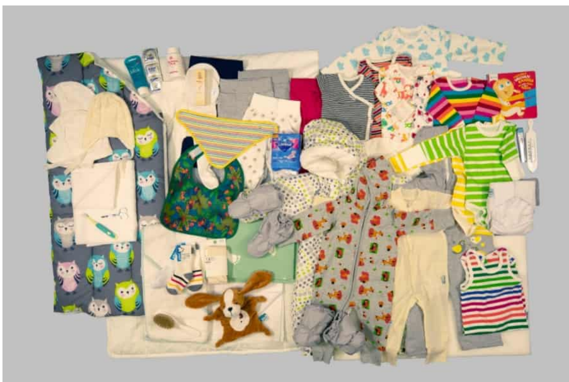
Innehållet i moderskapsförpackningen 2017.

Universitetsmuseet utökar i regel inte längre sina samlingar med