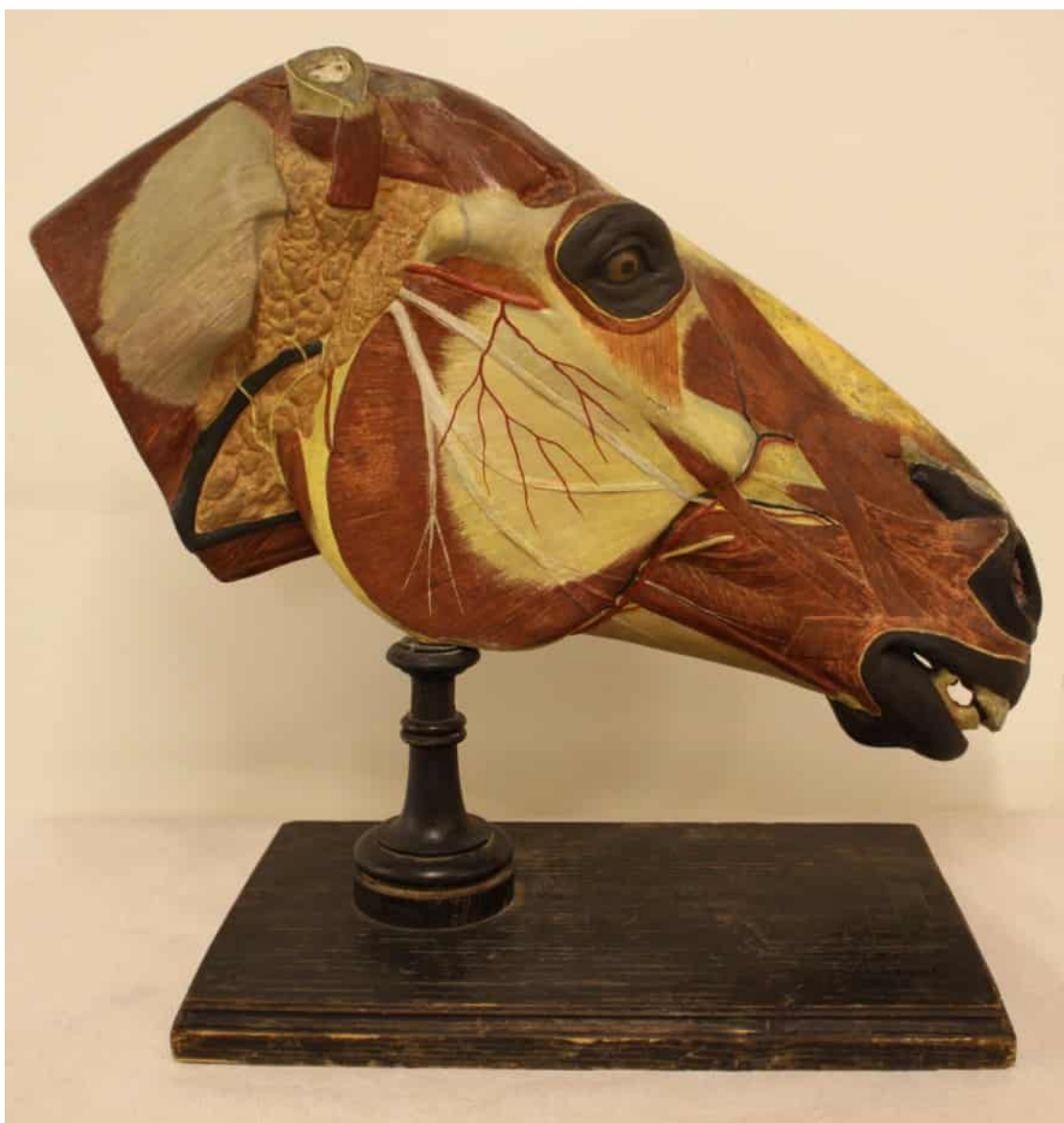
En anatomisk modell av ett hästhuvud.

Odontologiska museet grundades 1979 då Institutionen för odontologi flyttade från Fabiansgatan till Brunakärr. Museet drevs av frivilliga krafter och öppnade sin utställning 1982.