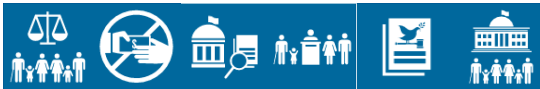
Kuva 2 Kestävän kehityksen tavoite 16 ja sen alatavoitteita.

Oikeusvaltiokeskuksen toiminta kokonaisuudessaan tukee Suomen hallitusohjelman tavoitteita ja sen osana Suomen kehityspolitiikan tavoitteiden toteutumista erityisesti painopisteessä 4. Rauhanomaiset ja demokraattiset yhteiskunnat. Oikeusvaltiokeskuksen toiminta kontribuoi erityisesti Suomen kehityspolitiikan tuloskartassa esitettyyn painopisteen outcome-tavoitteeseen 2 ja erityisesti sen outputiin 4, mutta myös outputeihin 2 ja 3. Oikeusvaltiokeskuksen toiminta edistää lisäksi ylätasolla Suomen kehityspolitiikan painopistettä 1. Naisten ja tyttöjen aseman ja oikeuksien vahvistaminen (Oikeusvaltiokeskuksen toiminta ei tue suoraan Suomen kehityspolitiikan tuloskartan ja muutosteorian tavoitteita painopisteessä, vaan kontribuoi laajemmin tavoitteeseen naisten ja tyttöjen oikeuksien edistäminen).