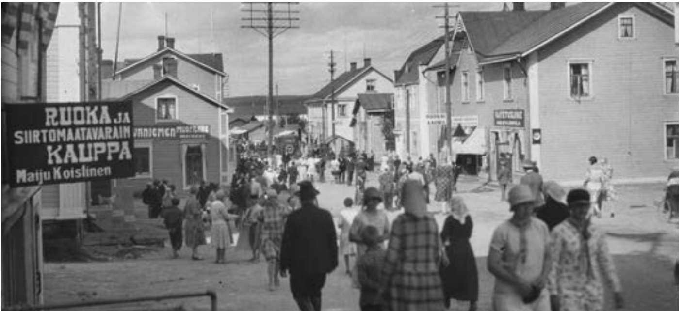
Kaupungistuminen muutti suomalaista yhteiskuntaa etelästä pohjoiseen. Kuvassa ihmisvilinää vuoden vanhassa Rovaniemen kauppalan keskustassa juhannusaattona 1930.