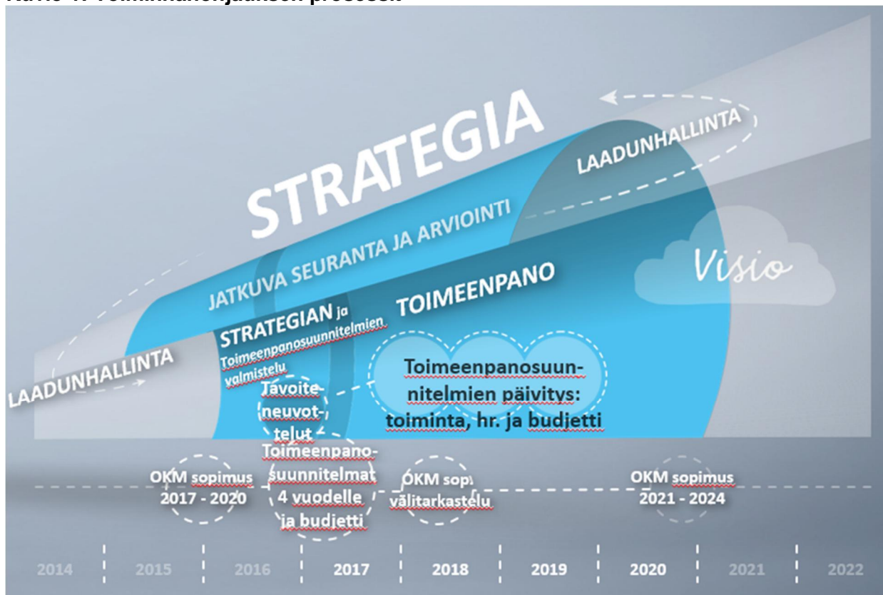
Kuvio 1: Toiminnanohjauksen prosessit

Yliopisto seuraa strategian toteutumista vuosittain osana toiminnanohjausprosessia.