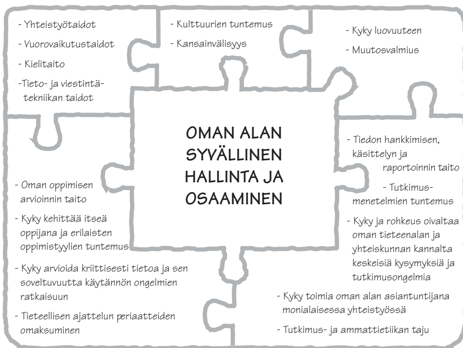
Kuvio 1. Laadukkaan tieteellisen tutkinnon osa-alueet

Tutkintokoulutusta kehitettäessä otetaan huomioon, että akateemisesti koulutetut asiantuntijat toimivat yhä enemmän tehtävissä, joissa edellytetään kulttuurien tuntemusta, kansainvälisyyttä ja muutosvalmiutta sekä erilaisten toimintaympäristöjen, etenkin elinkeinoelämän tuntemusta. Erityisesti tohtorikoulutuksessa vahvistetaan työelämä- ja yritys yhteyksiä.