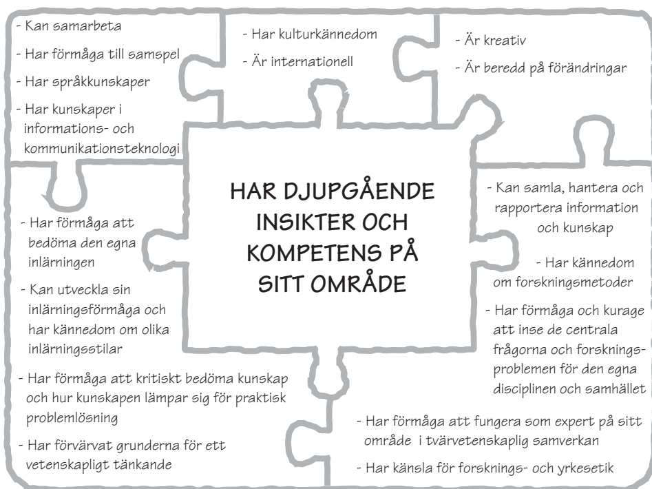
Figur 1. Delområden av en högklassig vetenskaplig examen

Den examensinriktade utbildningen utvecklas så att den beaktar att akademiskt utbildade experter allt oftare arbetar med uppgifter som förutsätter kännedom om olika kulturer, internationalism och en beredskap till förändring samt kunskap om olika verksamhetsmiljöer, speciellt näringslivet. Speciellt inom utbildningen av doktorer stärks kopplingen till arbetslivet och företagen.