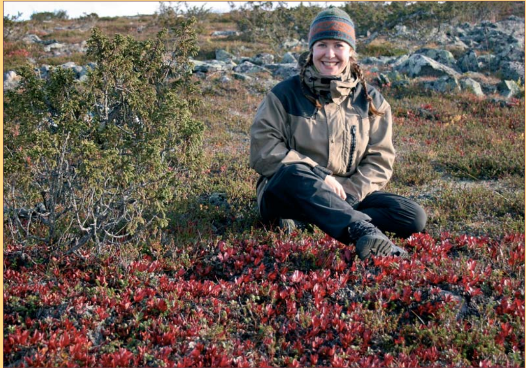
Teksti Marja Kerttu Kurkela

Päivät aloitti Imre Kovách Unkarin tiedeakatemiasta tarkastelemalla kulttuuria maaseudun kehittämisen resurssina. Tähän teemaan palattiin päivien aikana useaan otteeseen. Esimerkiksi maaseudun idyllin käsite tarjoaa pohdittavaa, sillä se voi toisaalta olla markkinointiväline, mutta toisaalta se voi saada aikaan maaseudun museoimisen ja jarruttaa liiketoiminnan kehittämistä. Maaseutukuvan muodostaminen on osaltaan valtavaa, jota kehittämiseen käytettävissä olevat resurssit ohjailevat. Kaupungeista käsin maaseutu määrittyy erilaisista lähtökohdista tai tarkoituseristä