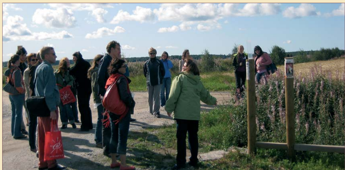
Kongressin oheistapahtumina järjestettiin monia tutustumisretkiä lähiseudulle. Kongressin osallistujia The Rural Bites Back – "Big Bang" -retkellä Söderfjärdenissä, joka syntyi meteoriitin iskeytyessä maahan noin 560 miljoonaa vuotta sitten. Nykyään paikka on viljeltyä peltoaukeana.

Edellisen kerran tapahtuma järjestettiin Suomessa vuonna 1981. Tänä vuonna 50 vuotta täyttäneen Euroopan maaseutusosiologisen yhdistyksen seminaari järjestetään joka toinen vuosi. Suomessa tilaisuuden järjestäjinä olivat Vaasan yliopisto ja Åbo akademi. ■