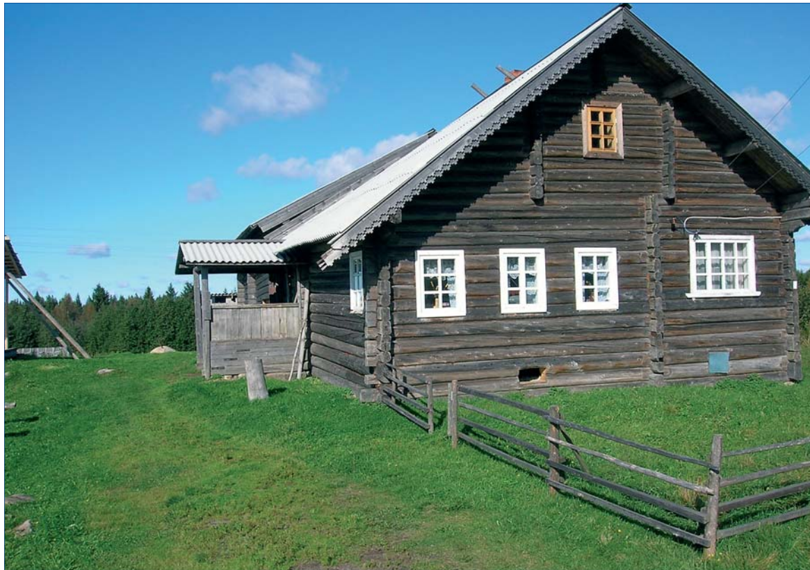
Venäjän karjalaisessa Kinnermäen kylässä toimii matkailuyritys, joka vaalii myös karjalaista perinnerakennuskulttuuria.