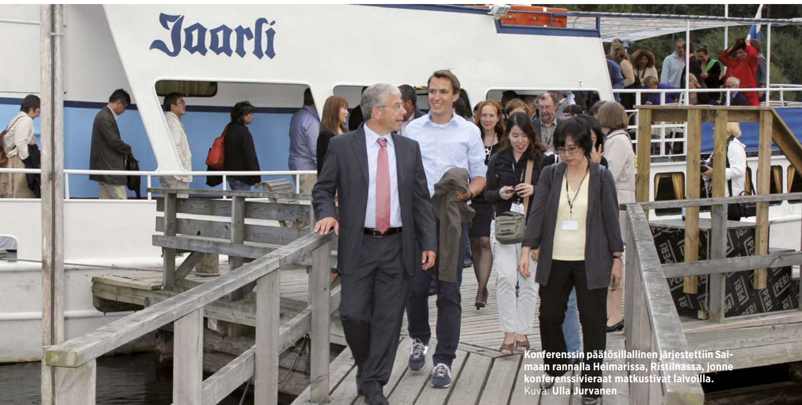
Konferenssin päätösillallinen järjestettiin Saimaan rannalla Heimarissa, Ristilnassa, jonne konferenssivieraat matkustivat laivoilla.

Professori Tapani Köpän mukaan osuustoiminnassa yhdistyvät tieto, taidot ja luovuus.