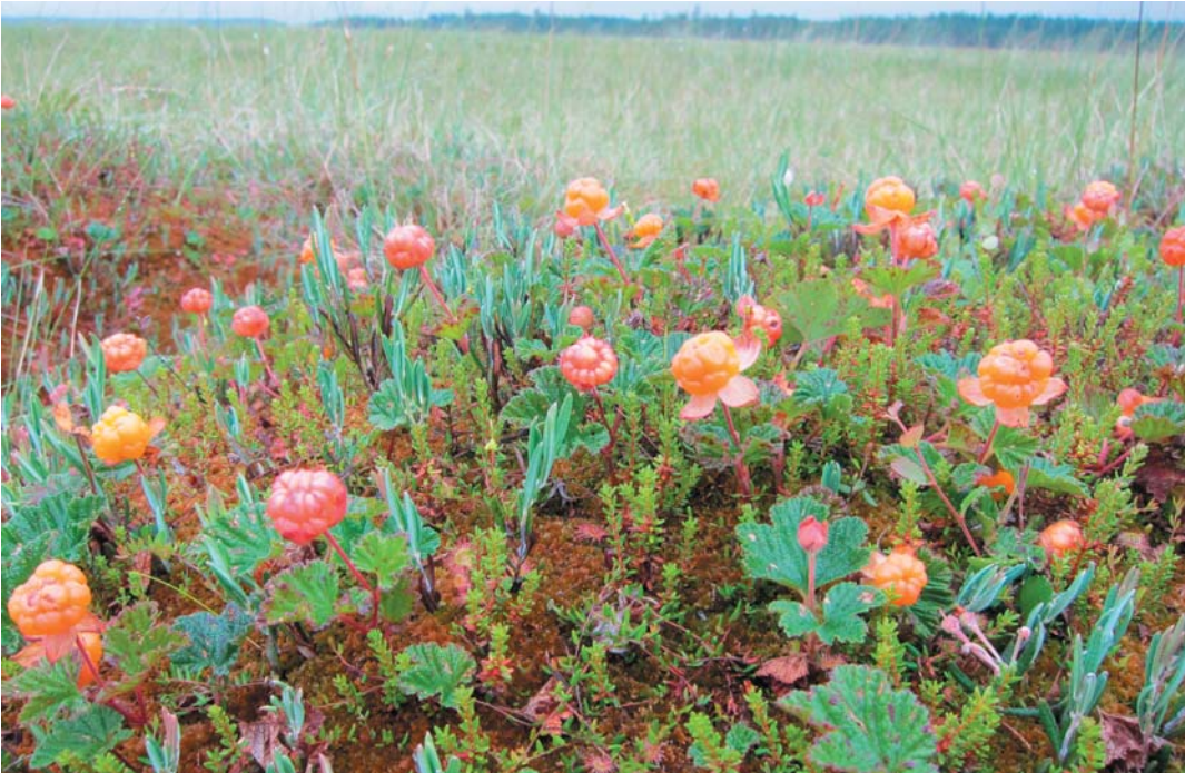
Kuva 2. Soiden luonnontuotevaroista tutuimpia ovat lakat ja karpalot, mutta pinnan alta voi löytyä myös laadukasta kylpy- ja hoitoturvetta.

Keski-Pohjanmaan toimijoille ja yrityksille suunnatuissa haastatteluissa mahdollisuuksia tarjoavina luonnontuotteina esille nostettiin muun muassa kylpy- ja hoitoturve, marjat, yrtit, sienet, jäkälät ja sammalet, mahla, kaisla, leikkohavut sekä pakuri. Lisäksi erityisesti lakkaa ja karpalorähtiä voitavan viljellä tai puoliviljellä. Kuitenkin kovin tarkkaa raaka-ainelajien rajausta tai määrittelyä haastatteluissa ei osattu sanoa.