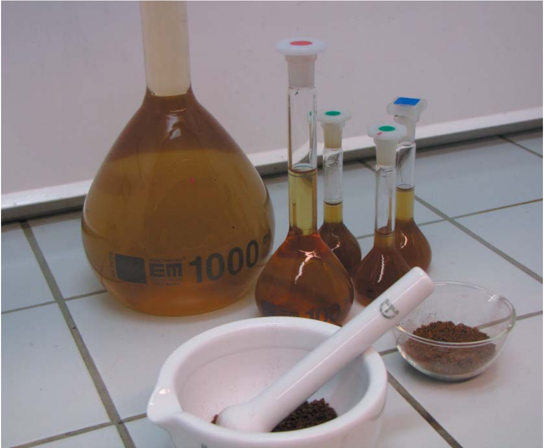
Kuva 5. Keski-Pohjanmaan vahvuuksia ovat soveltavan kemian osaaminen sekä monipuoliset analyysi- ja testauspalvelut, joita on hyödynnettävissä myös luonnontuotealalla.

Luonnontuotealan kehittymisen merkittävimpinä aihealueina Keski-Pohjanmaalla haastatellut näkivät erityisesti metsämarjojen jalostuksen elintarvikkeiksi, luonnontuotteiden viljelyn ja talteenoton luonnosta, ravintolisien valmistamisen, eläinrehujen valmistamisen, luonnontuotteisiin tukeutuvien matkailu- ja hyvinvointipalveluiden tarjoamisen sekä alan koulutus- ja neuvontapalveluiden tarjoamisen. Lisäksi maakunnan toimijoitten osaamisalueitten perusteella merkittävä ala voi olla myös hyvinvointituotteiden valmistaminen.