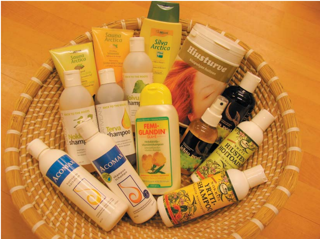
Kuva 6. Hyvinvointituotteiden valmistuksessa hyödynnetään yhä useammin luonnontuotteita. Kuvassa on valikoima kotimaisia ihon ja hiusten hoitoon kehitettyjä tuotteita.

jaon kehittämistä. Luonnontuotealan tunnettuutta tulisi lisätä. Yrityslähtöistä raaka-ainetutkimusta ja luonnontuotteiden viljelyn kehittämistä tarvittaisiin. Lisäksi alan yritystoiminnassa ratkaisuja voisivat olla yhteishankintarengas, lähituotetukku tai alan osuuskunta.