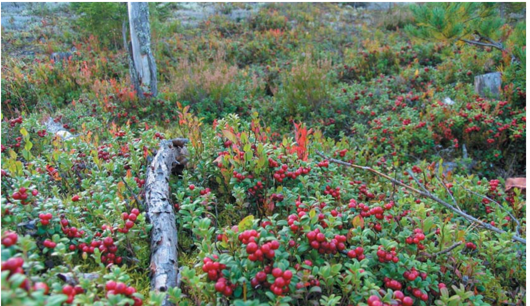
Kuva 1. Puolukka on Keski-Pohjanmaan metsien satomäärältään merkittävin marja.

Luonnonmarjojen kotitalouskäytön osalta Pohjois-Pohjanmaalla tehdyn selvityksen (Mikkonen ja Moisio 2011) mukaan kyselyyn vastanneiden kotitalouksissa poimittiin metsistä marjoja talteen 90 %:ssa talouksista ja keskimäärin noin 30 kg taloutta kohti. Mikäli Keski-Pohjanmaan marjojen kotitalouspoiminta arvioidaan samalle tasolle, maakunnan taloudet (asutokuntia noin 29 000) poimisivat omaan käyttöön 780 000 kg luonnonmarjoja tavanomaisena vuotena. Todellinen määrä on todennäköisesti pienempi, koska kyselyyn vastanneet saattoivat olla keskimääräistä kiinnostuneempia marjojen poiminnasta. Luonnonmarjojen poiminta kotitalouskäyttöön jäänee Keski-Pohjanmaalla selvästi alle 10 %:iin kokonaissadosta.