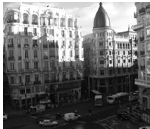
Pääkatu Gran Via

Madridin yöelämä on todella vilkasta ja monipuolista. Yksi selkeä baareja ja klubeja erottava tekijä on musiikki. Yleensä baarisissa soitetaan koko illan ajan saman tyyllilajin musiikkia esimerkiksi Tribunalin alueella olevat ravintolat keskittyvät lähinnä brittirockiin ja indieen, kun taas pääkaduilla on useita tasokkaita klubeja. Hintataso on selvästi Suomea edullisempaa, luukuun ottamatta kaikkein ylläisimpiä (posh) yökerhoja. Illanvietto aloitetaan Espanjassa myöhemmin kuin Suomessa yleensä vähän ennen puoltayötä. Syitä tähän saattavat olla myöhemmin päättyvät työpäivät ja ravitsemusliikkeiden pidemmät aukioloajat. Baarit sulkevat ovensa yleensä puoli neljän aikoihin aamuyöstä ja tämän jälkeen halukkaat voivat vielä siirtyä erilaisille klubeille, joissa juhliminen jatkuu aamun tunneille saakka.