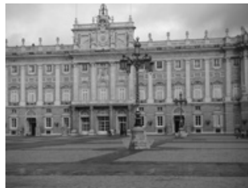
Kuninkaallisten palatsi Madridissa

non hankinta on Madridissa täysipäiväistä työtä, joten aluksi kannattaa varata riittävästi aikaa hostellista. Hostelleissa on usein ennen lukukausien alkua monia ulkomalaisia opiskelijoita, jotka etsivät asuntoa kaupungista. Yhdessä asuntojen etsiminen on paljon helpompaa, tehokkaampaa ja vähemmän turhauttavaa. Kaikista paikallisista kavereista ja tutuista on myös korvaamatonta apua asunnon etsimisessä ja käytännön asioiden hoitamisessa.