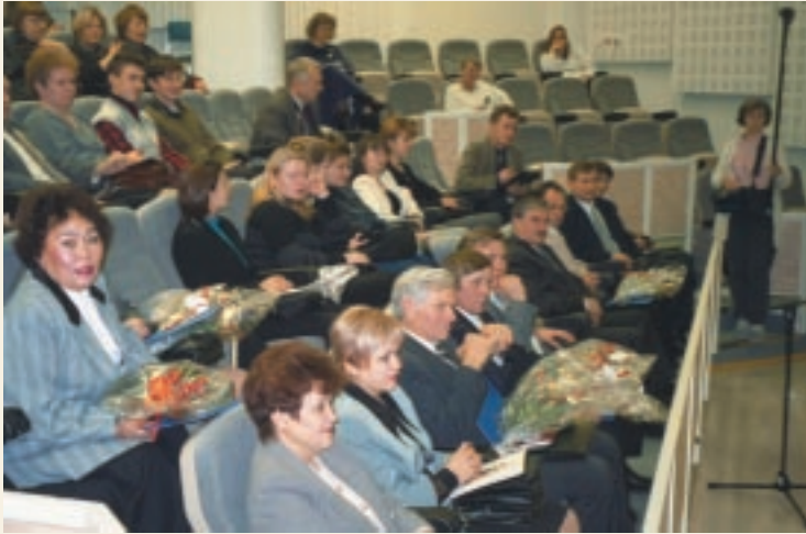
M. A. Castrénin seuran tv- ja radiojournalisti-palkinnot jaettiin YLE:n radio- ja televisio-instituutissa vuonna 1999.