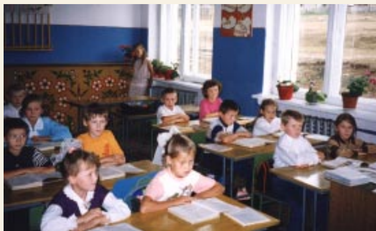
Alueet päättävät itsenäisesti, miten kansallisten vähemmistökielten opetusta kehitetään.

YK:n alkuperäiskansojen foorumin asiantuntija