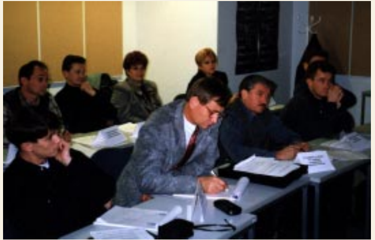
YLE:n tv-dokumentti- ja ajankohtaisohjelmien kurssilla vuonna 1999 perehdyttiin muun muassa dokumenttiohjelmien tekoon Suomessa ja Euroopassa.

kohtaisohjelmien seminaari Komin, Marin ja Udmurtian sekä Jamalin Nenetsian ja Permin Komin tv-yhtiöiden toimittajille. Vuonna 2003 järjestettiin tv-uutistoimittajakurssi Komin tasavallan televisiokanavan edustajille.