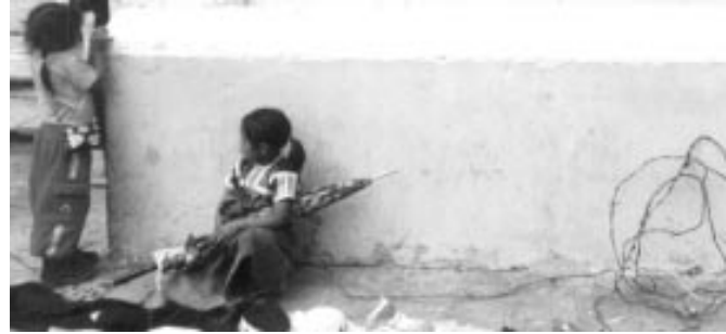
Meksikolaislapsia myymässä käsitöitä.

“Se vähän riippuu. Monen lukemani paperin mukaan on ensiarvoisen tärkeää, että tekniikka sopii ympäristöönsä. Joskus voi olla parempi katsoa mallia naapurimaista kuin täältä pohjoisesta.”