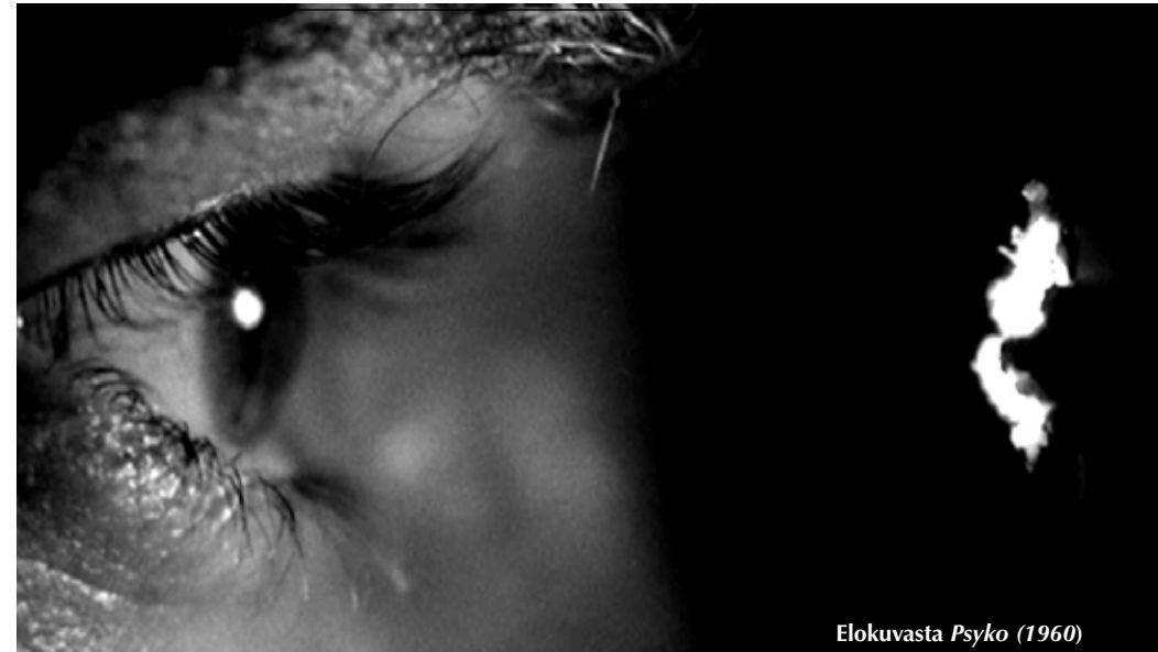
Elokuvasta Psyko (1960)

Taidetyylit ja taiteilijat eivät ole täysin sekaisin Hitchcockin elokuvissa, sillä sa- massa elokuvassa esiintyvät taiteilijat edus- tavat samaa (maantieteellistä) aluetta sekä