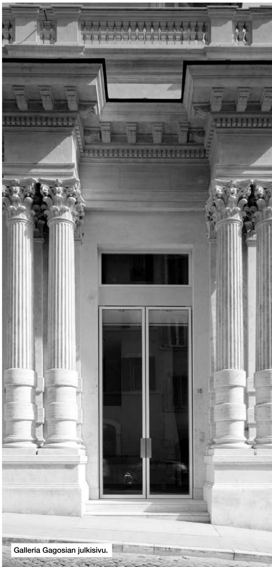
Galleria Gagosian julkisivu.

Maalaukset Untitled I-III muodostivat gallerian ovaalinmuotoisessa pääsalissa alttaritaulumaisen triptyykin. Suurikokoisissa teoksissa Twombly on maalannut valkoisella maalilla vihreälle taustalle valuvia, koukeroisia, arabialaista kirjoitusta muistuttavia vertikaaleja merkkejä: kolme kukoistavaa viestiä Shalalahista. Ja onhan Shalalah onnellinen Arabia, Arabia Felix, meren äärellä sijaitseva vuorten ympäröimä