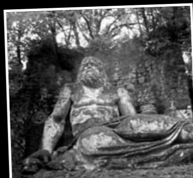
ROOMALAISTEN MERENJUMALA NEPTUNUS

rakkaudelle, joka rakentuu pala palalta puutarhassa kävellessä. Vaikka puutarhan luonne ja sen veistosten merkitykset olivat ennalta määrättyt, veistoksien sijoittelu sen sijaan ei ollut, vaan ne ovat kaiverrettu ja veistetty suoraan paikan päältä löydettyistä valtavista kivistä.