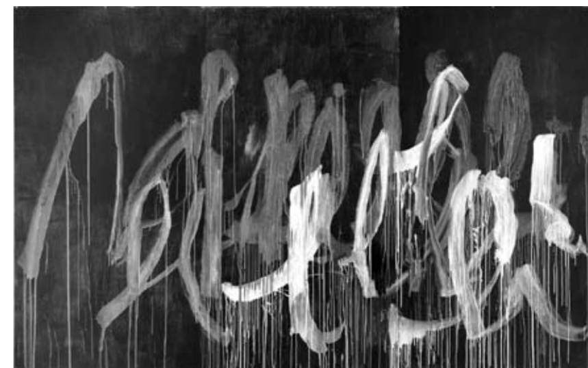
Cy Twombly: Untitled I , 2005–2007. Akryyli puulle.

Testacchion kaupunginosassa, vanhassa teurastamossa, MACRON sivugalleriassa MACRO Futuressa oli esillä venäläinen taiteilijaryhmä AES+F. Kiasman ARS 06:stakin tuttu ryhmä esitteli videoita, valokuvia ja veistoksia ryhmän kymmenvuotisen uran ajalta. AES+F teosten apokalyptisen maailman pääosassa ovat kauniit, enkelikasvoiset lapset ja nuoret, kuvattuina kliinisisä taistelukohtauksissa ilman tunteita tai edes fyysisiä, kehollisia jännitteitä. Tyyllisesti kuvat seuraavat nykypäivän mainoskuvien, videopelien ja muotikuvien kuvastoa. Teoksissa kaikki käyvät sotaa kaikkia vastaan erilaisten aseiden avulla jossakin katsojalle tuntemattomassa, elottomassa maailmassa. Väkisinkin tulee mieleen ajatus siitä, että tämä on taiteilijoiden varoittava visio maapallon