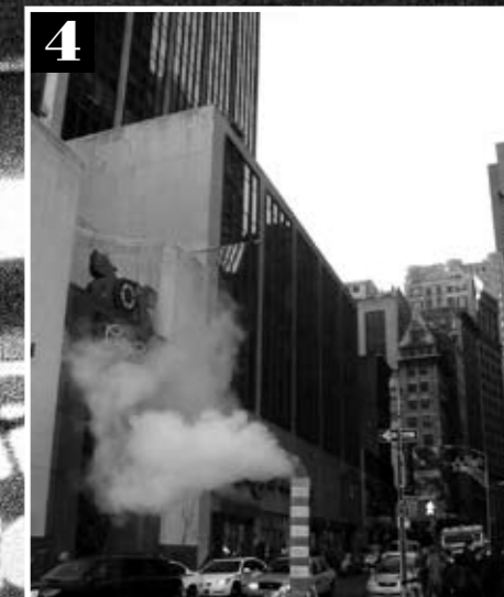
1. Kaikki tunnistavat Empire State Buildingin. 2. New Yorkin museotarjonta on hulpea. 3. Julisteissa kehoitetaan ilmiäntamaan laittoman käsiaseen haltija. 4. New Yorkin kadut kuhisevat elämää.