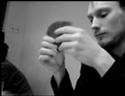
Ainaisille baariperjantaille vaihtoehtoja etsiville: DJ Zzompp!

Kiinnostuneille: kevään mittaan joitakin kertoja Korjaamolla, tarkemmat ajankohdat osoitteesta www.euphoriaborealis.net .