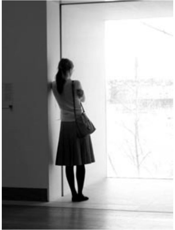
Moderna museet, Tukholma, naistenpäivänä 8.3.2005

Yhdistyksen Eidos ry:n organisaattorit olivat tänäkin vuonna järjestämässä jäsenistölle hyötyä ja huvia. Lukea voit maaliskuisen Tukholman ekskursioon herättämistä huomioista ja tulevista tutkinnollisista mullistuksista. Unohdettu ei kuitenkaan ole oma innoittajamme ja olemassaolo... opiskelumme syy ja sydämiemme tahdistin: eidoslaiset ovat paitsi taiteen tutkijoita, myös kokijoita. Mobile horror? Tuskinpa.